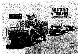
So enthüllte der stern vor vier Wochen, wie deutsche Waffen im Jemen zum Einsatz kommen