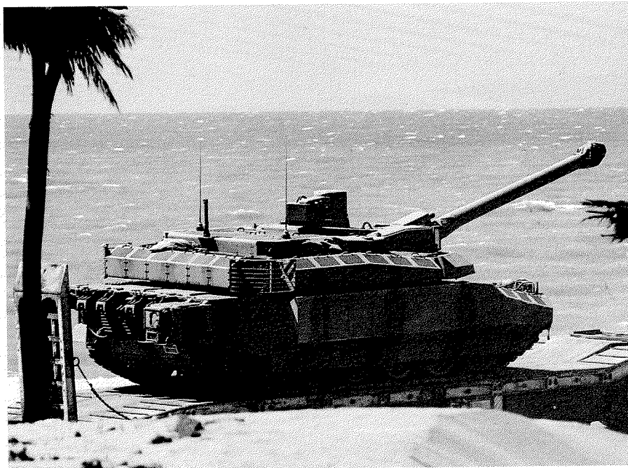
Mit deutscher Schutztechnik: ein Leclerc-Panzer im November 2018 in Hudaida im Jemen

B undeswirtschaftsminister Peter Altmaier ist Teil einer demokratisch gewählten Regierung. Manchmal aber geriert er sich wie ein Emir, dem keiner was kann – besonders, wenn es um das heikle Thema der deutschen Waffenlieferungen an arabische Scheichs geht.